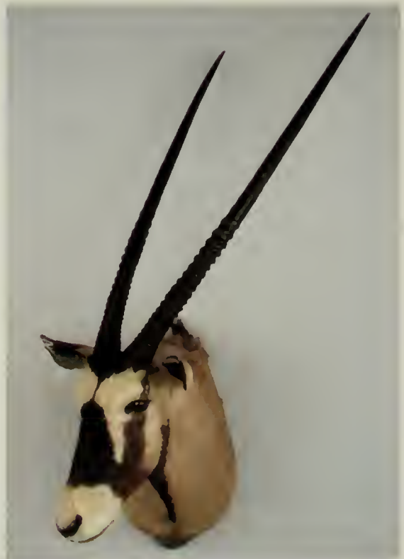
A sinistra: Orice beisa ( Orix gazella beisa Rüppel, 1835); a destra: Orice meridionale ( Orix gazella gazella L., 1758).